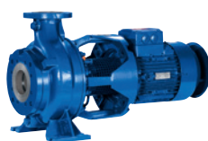
KWP®** Pompe horizontale à volute, à plan de joint radial, en exécution process

* disponible également avec PumpDrive, PumpMeter et le moteur KSB SuPremE® IE4**