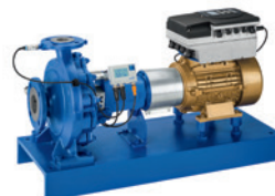
Etanorm® / Etabloc® Pompe à volute / pompe monobloc à volute horizontale, avec le variateur de vitesse PumpDrive, l'unité de surveillance PumpMeter et le moteur KSB SuPremE® IE4**

* disponible également avec PumpDrive et le moteur KSB SuPremE® IE4**