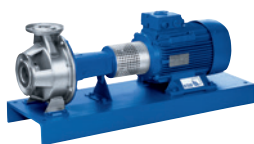
Etachrom®** Pompe horizontale à corps annulaire, monocellulaire

* disponible également avec PumpDrive, PumpMeter et le moteur KSB SuPremE® IE4**