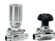
SISTO-C Robinet à membrane sans maintenance