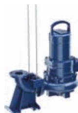
Installazione sommersa con funi di guida