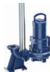
Installazione sommersa con tubi di guida