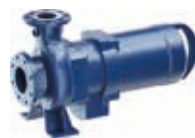
Installazione a secco orizzontale